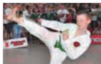
Taekwondo girls and boys U13 - U17 - U21