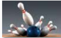
Bowling girls and boys U14 - U18