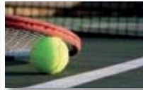
Tennis girls and boys U13 - U16 - U18 - U21