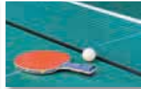
Tabletennis girls and boys U13 - U16 - U18 - U21