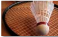
Badminton girls and boys U13 - U16 - U18 - U21