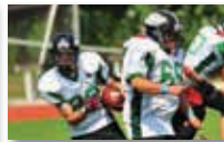
American Football boys U12-U14 - U16 - U19