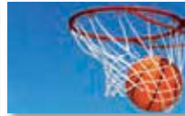
Basketball girls and boys U12 - U14 - U16 - U18