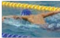
Swimming girls and boys U12 - U14 - U16 - U18